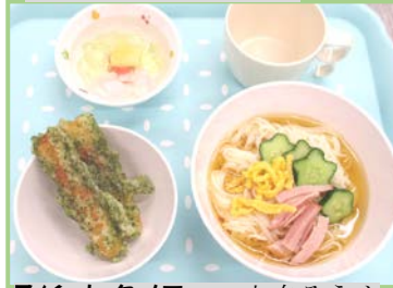
7/6 ヒタメニュー セタそうめん、ちくわのてんぷら、キラキラゼリー、牛乳 or 日本茶