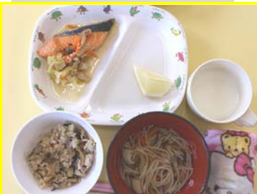
9/4 ひじきご飯、そうめん汁、鮭のちゃんちゃん焼き、グレープフルーツ、牛乳 or 日本茶