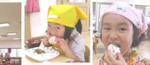
6/15 さくら組 おにぎりクッキング昼食会(サンサン遊戯室) 自分で好みのおにぎりをにぎって もりもり食べました!!