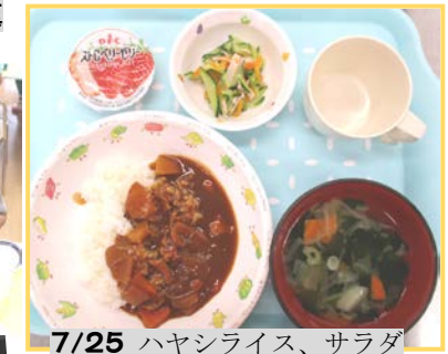
7/25 ハヤシライス、サラダわかめスープ、ゼリー、牛乳 or 日本茶