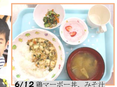
6/12 鶏マーボー丼、みそ汁きゅうりのユカリ和え、フルーチェ、牛乳 or 日本茶