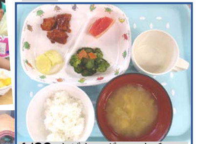
6/22 カジキマグロのケチャップ和え、こぶきイモ、青菜のおひたし、みそ汁、牛乳 or 日本茶