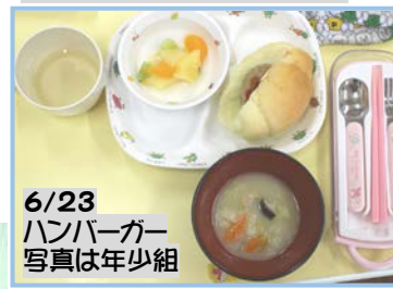
6/23 ハンバーガー 写真は年少組

年中・年長組は、自分でハンバーガーをパンにはさんで食べました。そのほかに、クリームシチューミックスフルーツ、牛乳 or 日本茶