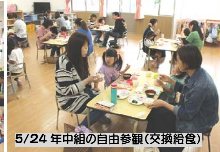
5/24 年中組の自由参観(交換給食)