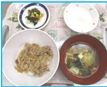
6/2 ぶた井、みそ汁、青菜のおかか和え、フルーチェ、お茶