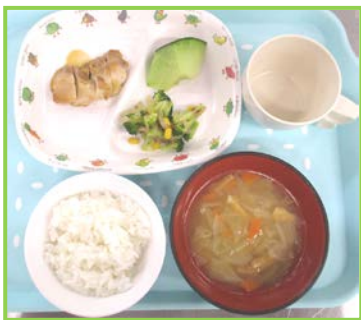
メニュー写真 と園児の表情