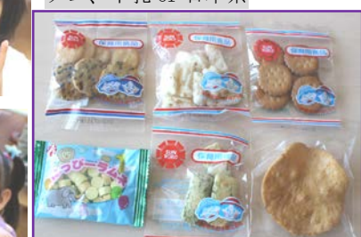
さくらんぼ組の午前のおやつ メニューにはお菓子やせんべいとなっていますが、写真のようなお菓子が日替わりで出ます